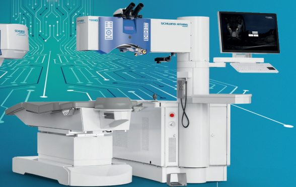
SCHWIND AMARIS Excimerlaser

Seit über 30 Jahren entwickeln wir bei SCHWIND Lösungen für die Hornhautchirurgie. Mit den Lasersystemen SCHWIND ATOS und SCHWIND AMARIS sowie Diagnosesystemen wie MS-39, SIRIUS+ und PERAMIS bieten wir ein umfassendes Portfolio für Augenlaserkorrekturen und präzise Behandlungsplanung.